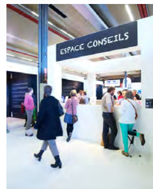
Energie & Habitat