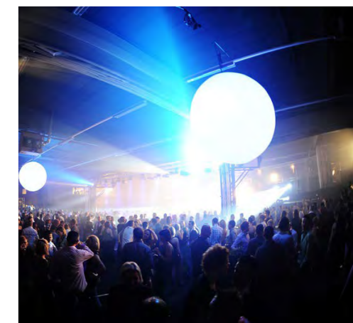
Les Folies Namuroises